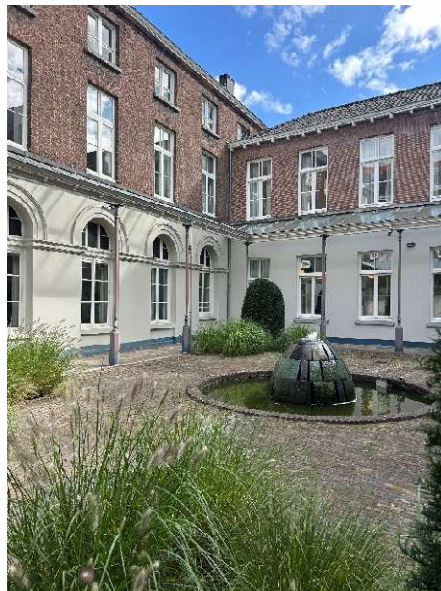
Foto: Reinier van Arkel, de oudste zorginstelling van Den Bosch, sinds 1442