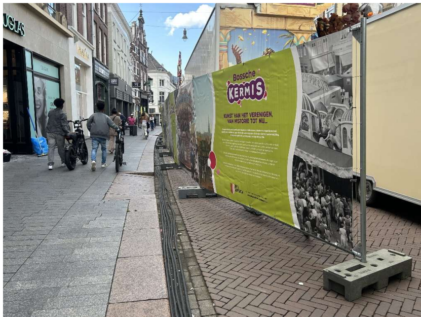
Foto: kermis Den Bosch, zomer 2025