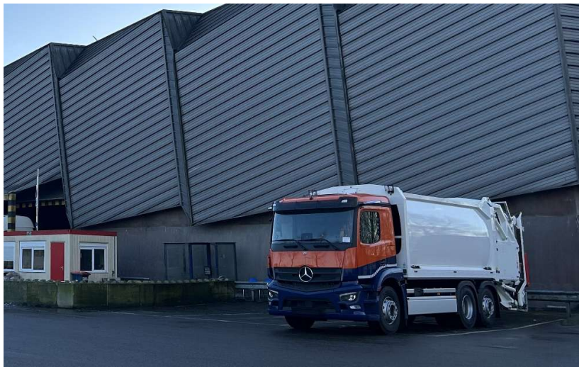
Foto: veel te dure elektrische vuilniswagen, milieustation Treurenburg